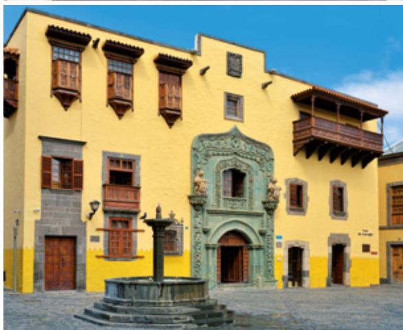
Santo Domingo Dům a socha Kryštofa Kolumba