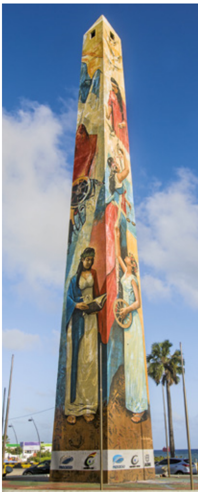
Obelisk na Malecon v Santo Domingo

ako sú cigary, rum, bavlnené oblečenie a iné.